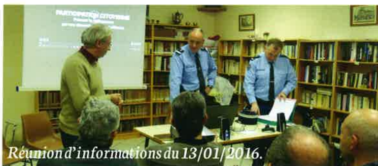
Réunion d'informations du 13/01/2016.

Le point a été fait sur tous les travaux de 2015 et ceux à programmer sur le budget 2016. Les travaux ont grevé une très grande partie du budget voirie 2015 (réalisation d'un enrobé sur les deux voies d'accès du lotissement) et sur 2016 des travaux de finition de la voirie sont en cours ainsi que la réalisation de différents ouvrages (piège à sable au pied de la falaise, ...). Demande est faite auprès des riverains pour la réfection de leurs accès privés, certains étant susceptibles de détériorer la voie publique rénovée. Nous souhaitons que les travaux réalisés soient pérennes pour de très nombreuses années permettant ainsi de consacrer les prochains budgets à d'autres quartiers en attente de travaux.