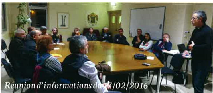
Réunion d'informations du 17/02/2016