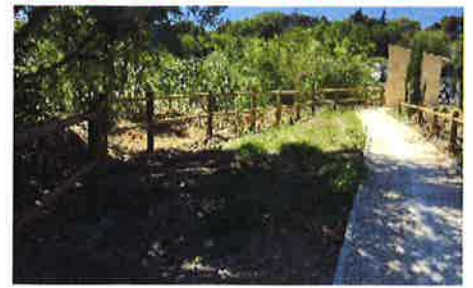
Nos aménagements paysagers